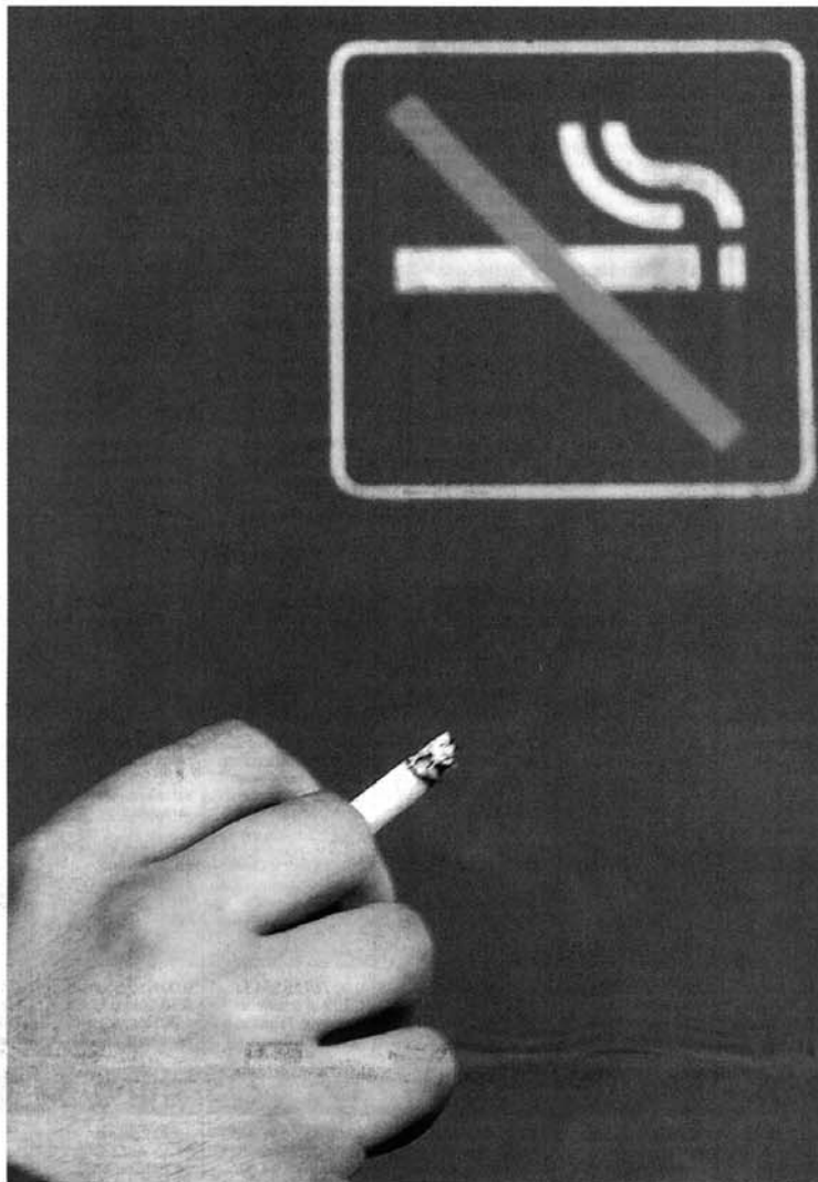
Die letzte Zigarette vor dem Einsteigen in den rauchfreien Regionalzug – wie lange noch?