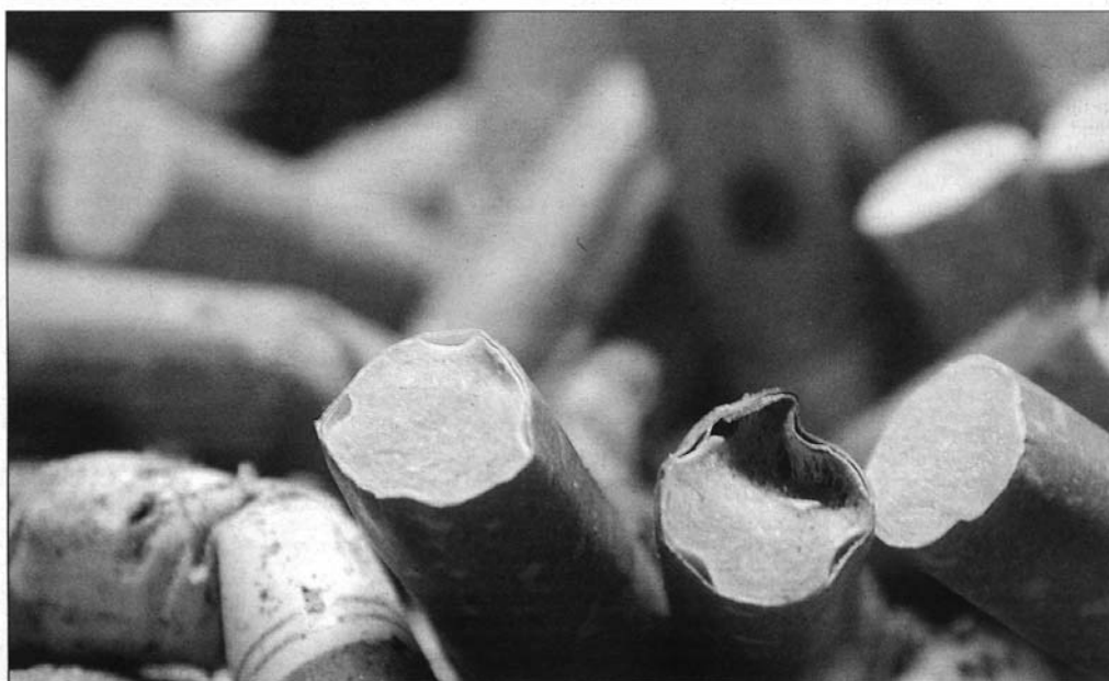
Kalter Rauch, überall Asche und die Kleider stinken. Mit Genuss hat Rauchen eigentlich recht wenig zu tun – das finden (zumindest hier und da) auch eingefleischte Nikotinsüchtige.

Hand aufs Herz. Welcher Nikotinabhängige kann mit voller Überzeugung sagen, dass er wirklich gerne raucht? Wahrscheinlich sehr wenige bis